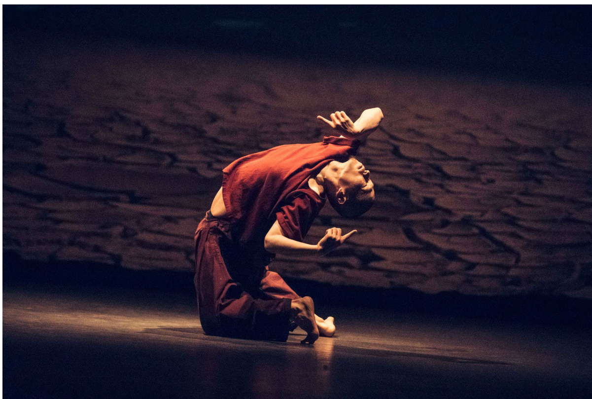
Fra NOMAD af Sidi Larbi Cherkaoui.

København Danser kunne i sæson 2022 præsentere produktionerne NOMAD af Sidi Larbi Cherkaoui på Folketeatret og Pina Bauschs Le Sacre du printemps og common ground[s] på Østre Gasværk Teater. Begge produktioner er af ekstraordinær høj international kvalitet og blev overordentlig vel modtaget af såvel publikum som anmeldere.